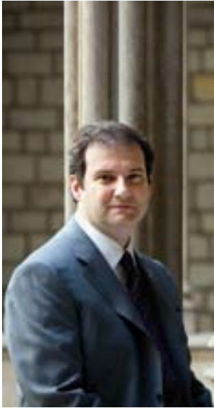
Jordi Hereu Alcalde de Barcelona