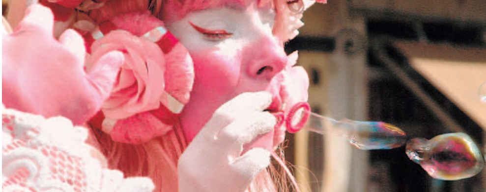
Jarek Dzilinski / Fotomercè 2003