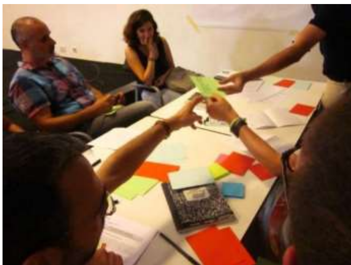
El dinamitzador recull una de les aportacions dels participants.