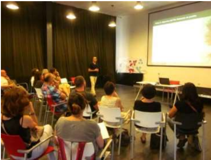
Exposició en plenari dels resultats dels grups de treball.