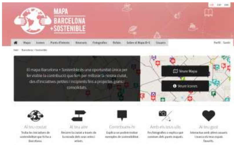
Capçalera del web del Mapa Barcelona + Sostenible