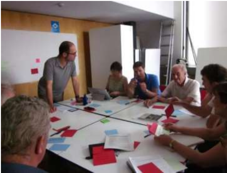
Un moment de reflexió en el si d'un dels grups de treball.