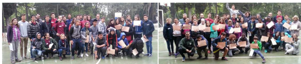
Foto de grup de tots els participants després de l'entrega de diplomes (dreta Institut Fort Pius i Institut Rubió i Tudurí, esquerra Escola Pres Pins i Institut Rubió i Tudurí).