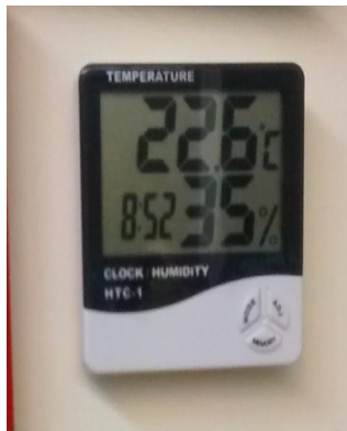
termòmetres per controlar millor temperatura