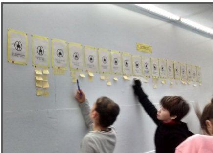
Preparant propostes de millora