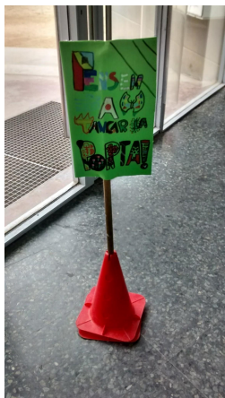
Mecanisme per a que la porta no quedi oberta