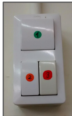
Senyalitzar en verd quin interruptor prioritzem