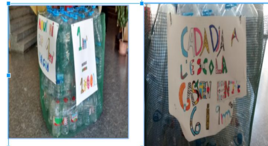
Visualitzar el que gastem